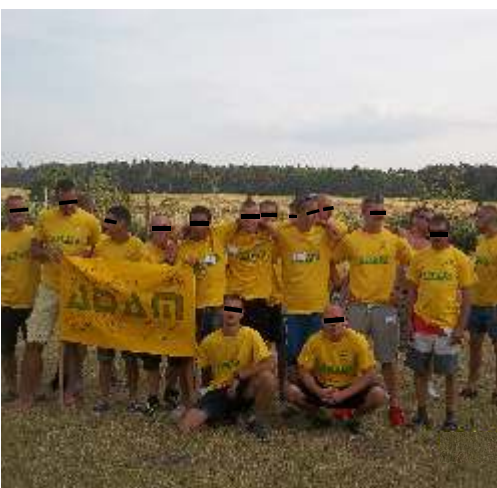
DRUŽSTVO ADAM NA COMUNITA CUP 2015

Resocializačné stredisko Adam, ktorého zriaďovateľom je Občianske združenie Adam, Staré záhrady 34, Bratislava je akreditovaný subjekt v zmysle zákona 305/2005 Z. z. o sociálnej ochrane detí a o sociálnej kuratele, určený na resocializáciu osôb s rôznymi druhmi závislostí.